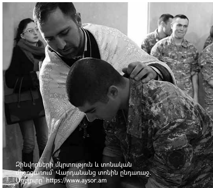
Զինվորների մկրտություն և տոնական միջոցառում՝ Վարդանանց տոնին ընդառաջ.

«Հ» ԱԺ պաշտպանության և անվտանգության հարցերի մշտական հանձնաժողովի նախաձեռնությամբ հոկտեմբերի 11-ին «Հ» ԱԺ նիստերի դահլիճում տեղի ունեցած «Զինապարտության և զինվորական ծառայության մասին օրենսդրական նոր կարգավորումների վերաբերյալ» թեմայով խորհրդարանական լսումների ընթացքում խնդրի շուրջ իր դիրքորոշումն արտահայտեց «Հ» պաշտպանության նախարար Վիգեն Սարգսյանը: Նա հայտարարեց, որ որեւէ խնդիր չի տեսնում, որ «Հ» զինված ուժերում գործում է Հայաստանյայց Առաքելական Եկեղեցու հոգևոր ծառայությունը, որ