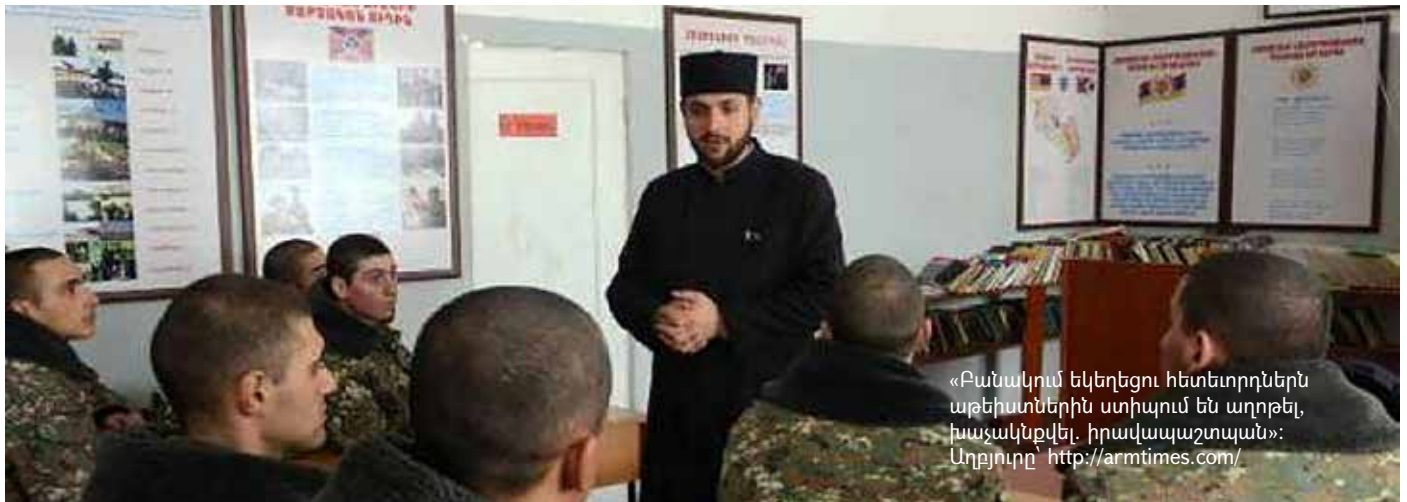
«Բանակում եկեղեցու հետետորդներն աթեիստներին ստիպում են աղոթել, խաչակնքվել, իրավապաշտպան»: Աղբյուրը՝ http://armtimes.com/